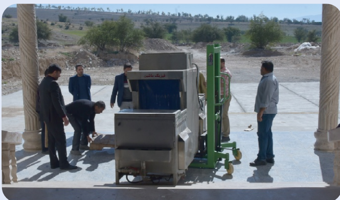
انتقال تجهیزات طبخ غذا به سلف سرویس مرکزی دانشگاه - اسفند 1402