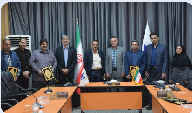
تجلیل از خانواده‌های شهدا و ایثارگران - 18 دی 1402