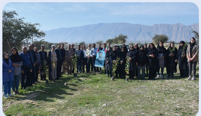
کاشت نهال با حضور خانواده‌های شهدا و ایثارگران در پردیس دانشگاه - 15 اسفند 1402