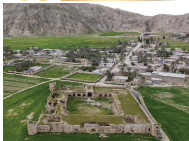
کاروانسرای ده کهنه - منطقه کمارج کازرون