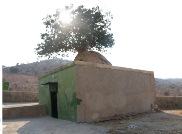
امامزاده پیربنکی - دشت برم کازرون

14 تجدید میثاق دانشگاهیان کازرون با آرمان‌های انقلاب