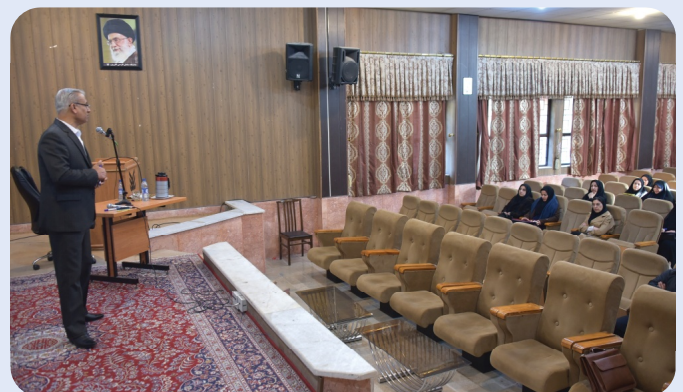
برپایی کارگاه‌های آموزشی ویژه یاوران علمی دانشگاه از سوی معاونت مالی و اداری - بهمن 1402